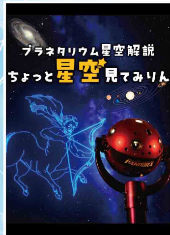
満天の星空の元で、その季節に見える星や星座のお話をします。