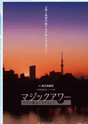
語り:和久井映見 制作:NHKエデュケーショナル 配給:ざらい