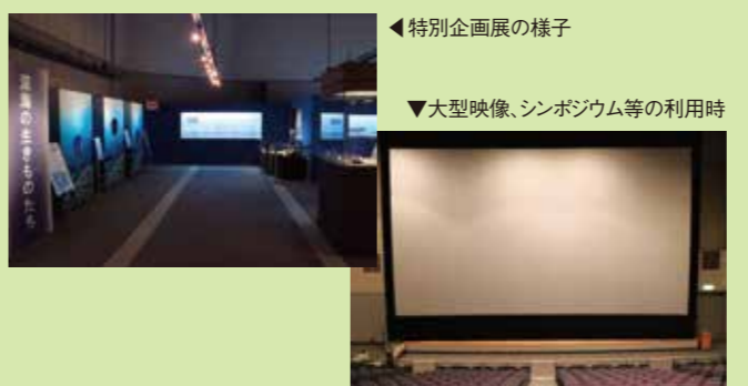
◀特別企画展の様子