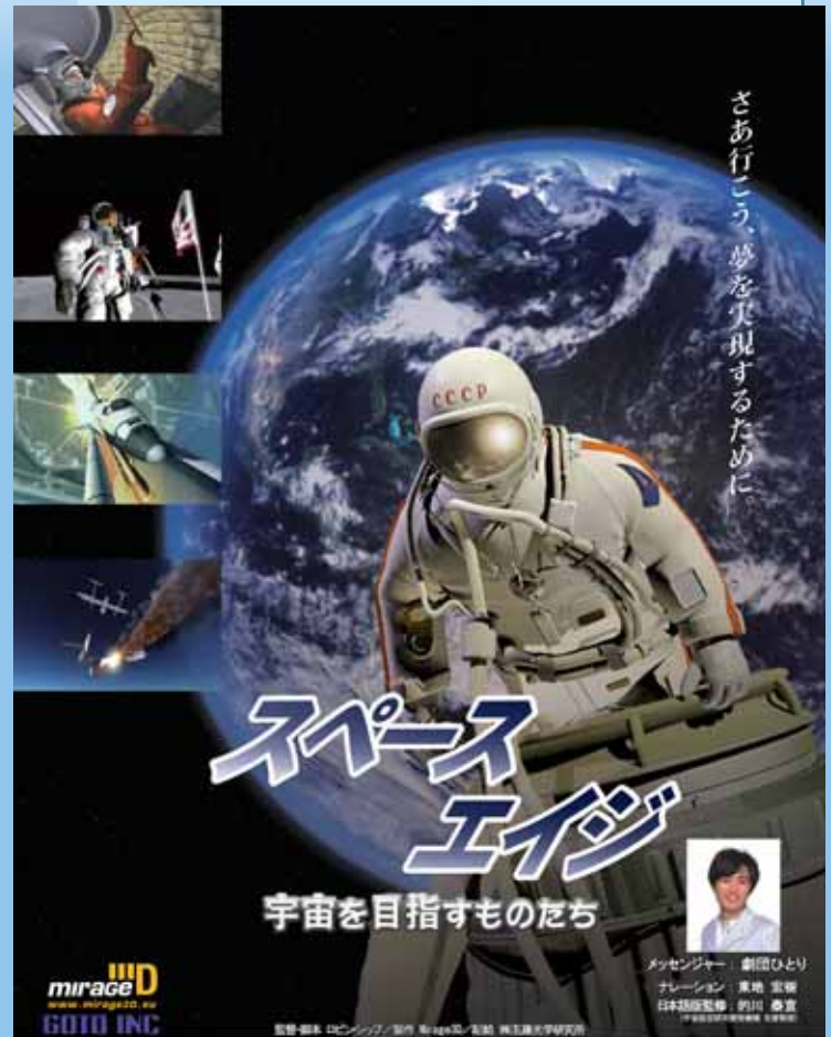
さあ行こう、夢を実現するために

現在の国際宇宙ステーションから未来の宇宙開発へ。私たち人類が新たな宇宙時代の夜明けを迎える日もそう遠くはないでしょう。