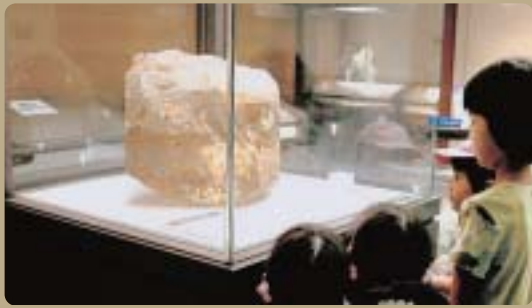
世界最大級のトパーズ原石 One of the world's largest pieces of Topaz.